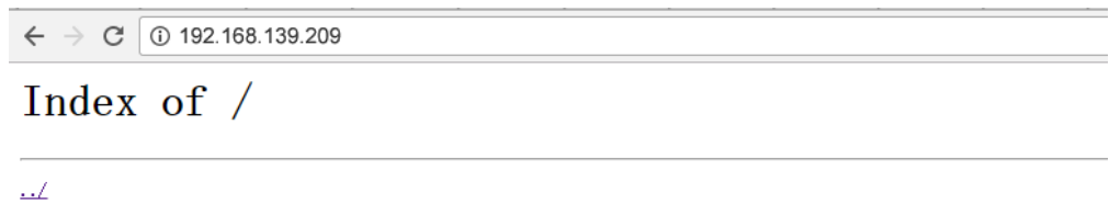
图8-3 nginx 部署成功